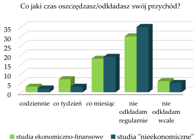
Rys. 2. Częstotliwość oszczędzania przez studentów

Według badań przeprowadzonych na potrzeby niniejszej rekomendacji, ponad połowa ankietowanych studentów nie odkłada regularnie swoich przychodów. Nie wykazuje również analitycznej wiedzy dotyczącej wpływu środowiska gospodarczego na kształt i wielkość swoich oszczędności. Na podstawie uzyskanych wyników oraz wiedzy teoretycznej rekomendujemy, aby zwiększyć siatkę godzinową oraz zmienić formę zajęć z ekonomii życia codziennego na model stricte praktyczny, w większym stopniu absorbujący uwagę ludzi młodych.